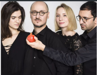
MUSIQUES DU MONDE, CLASSIQUE

En accord avec Muzivox. Peter Kingsbery grandit à Austin au Texas où il suit des études de musique classique. Il s'installe ensuite à Nashville (Tennessee) ; il y commence une carrière de musicien et d'auteur-compositeur. Au début des années 70s, il occupe le poste de clavier pour Brenda Lee avec qui il tourne aux USA et au Japon. En 1982, il crée le groupe Cock Robin. Il enchainera disque d'or et de platine avec ce groupe grâce à sa superbe voix et un sens aigüe de la composition et de l'arrangement. 6 titres apparaîtront dans le Top 50. Dans les années 90, Peter Kingsbery participe à Tycoon l'adaptation en anglais de Starmania. Il y interprète Only The Very Best, qui se classera tout en haut des charts en France. En 2006, le groupe Cock Robin se reforme et sort « I don't Want To Save The Word »