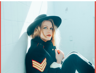
SOUL, BLUES, ROOTS

China Moses chante des chansons gaies avec une pointe de mélancolie heureuse, et des chansons tristes sans jamais tomber dans le pathos d'une tragédienne. Comme seuls ornements, China se permet des syncopes de sanglots qui jettent la pudeur aux orties avec la dialectique des remords et des regrets. Elle nous envoie des émotions purifiées à la flamme de sa voix. Sa voix, un cristal de roche compressé. Entre le rire et le sanglot, sur un fil, elle franchit nos défenses, nous pèle comme un oignon et nous voilà à nous mordre les lèvres pour ne pas chialer. André Manoukian, grand amoureux des voix, goûte, soupèse, jauge, questionne, titille, hume, respire, enrobe chaque mot de son délicat piano. Ils ont choisi la formule du duo pour laisser libre cours à leur dialogue. Gare au feu.