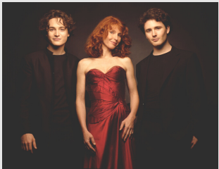
DU CLASSIQUE AU JAZZ

Aujourd'hui et pour la première fois le Bollywood Masala Orchestra vous embarque pour un voyage au nord de l'Inde, du Rajasthan à Mumbai (Bombay). Seize artistes, musiciens, chanteurs, danseuses, acrobates, cracheurs de feu, tous professionnels, venus de Jodhpur, Jaipur, Sikar, Khandela, Mumbai, parcourent le monde pour colporter la musique et la danse indienne d'hier et d'aujourd'hui !