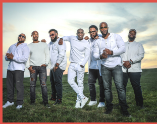
HUMAN BEAT BOX

A l'œuvre depuis 2014, Chromatik est un groupe de Jazz/Hip-hop Français. Après 3 EPs et après avoir parcouru toute la France, le groupe fait de la scène son terrain de jeu. Composé de 6 musiciens talentueux et explosifs ainsi que du rappeur Hi Levelz fraîchement sorti de l'émission « The Voice », le groupe séduit de manière élégante et survoltée, les amateurs de musique urbaine, comme les plus grands mélomanes.