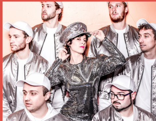
ELECTRO SWING, FUNK,

Naturally 7 est un collectif qui regroupe sept New-Yorkais, capable aussi bien de chanter à cappella, de rapper ou de faire du Beatbox. Ovationnée dans le monde entier, cette formation de sept musiciens propose une étonnante performance vocale ! Les Naturally 7 nous démontrent qu'ils peuvent tout faire avec leur voix : des instruments bruités à la bouche, aux sons identiques des meilleures guitares et autres harmonicas du monde. Leur répertoire se joue intégralement à capella, en polyphonie et en beat box... Les techniques sont magistralement maîtrisées et surtout dépassées pour susciter l'émotion du public.